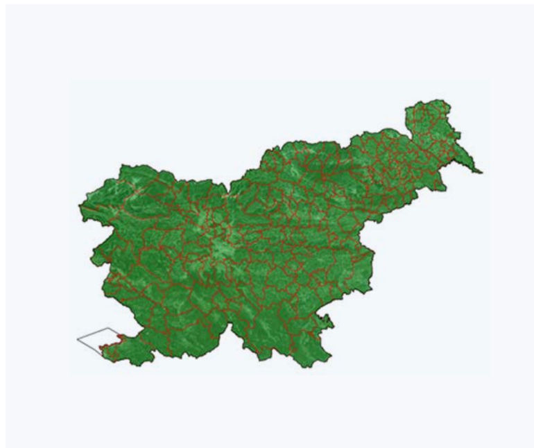
Slika 1: Stanje podatkov, dostopnih v pregledovalniku ESZ (15. junij 2021).

Rezultat masovnega zajema je predlog poseljenih zemljišč in dejanske rabe poseljenih zemljišč. Rezultati so dostopni na spletni strani Prostorskega informacijskega sistema – PIS oz. v pregledovalniku ( Slika 1 ).